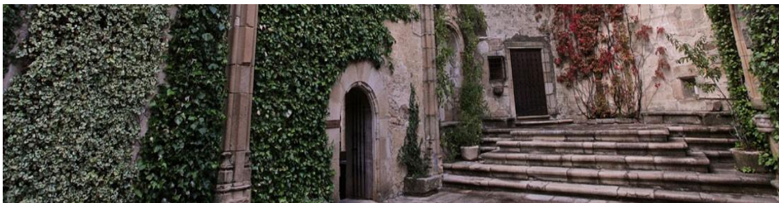
Fundación Xavier de Salas, Convento de la Coria, Trujillo, lugar de la 34ª Reunión

A todos ustedes por participar en este trigésimo cuarto encuentro de asociaciones, por animarnos con su presencia y con sus comunicaciones a seguir creyendo que hacemos algo útil y necesario al convocar anualmente este encuentro de Asociaciones de Patrimonio.