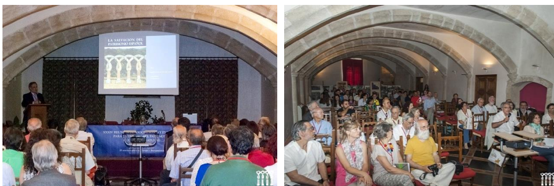
Distintos momentos de la 34 Reunión de Trujillo: conferencia y debate

En otras ocasiones he expresado mi convicción de que este deseo de las asociaciones de estar juntas (y unidas) tiene varias razones, pero no es menor la de que refleja una aceptación del papel aglutinador de Hispania Nostra y muestra la necesidad de las diferentes asociaciones y entidades ciudadanas de contar con un organismo federalizador no estatal, un lugar donde las asociaciones se muevan entre iguales y no controladas por una autoridad emanada de instituciones públicas. Deseamos fomentar el apoyo mutuo y la reflexión conjunta respecto a alguno de los múltiples temas que nos preocupan, intentando desde la sociedad civil no sólo ayudar a conservar nuestro Patrimonio, sino incluso adelantarnos buscando soluciones a problemas nuevos que puedan plantearse en relación con nuestro patrimonio Cultural.