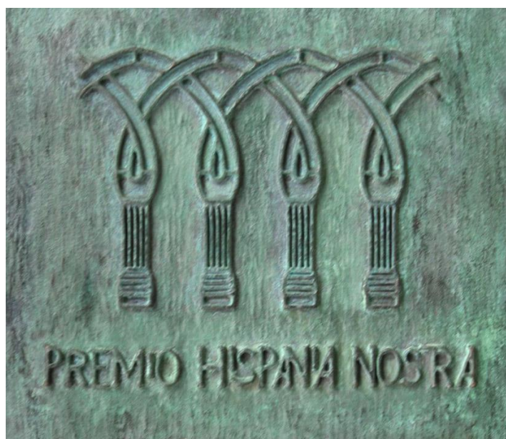
Placa de los Premios Hispania Nostra

La acequia llevaba más de 30 años abandonada debido a la fuerte emigración sufrida por la comarca; su recuperación ha servido para suscitar un interesante debate sobre las políticas de conservación de las prácticas e infraestructuras agrarias tradicionales en el contexto del Espacio Protegido de Sierra Nevada y en el escenario de cambio global.